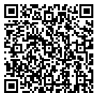
Tabelle 61.2 / Stand: 10.12.2020