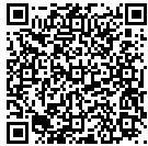
Tabelle 61.1 / Stand: 10.12.2020